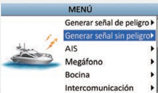
Pantalla del menú

La pantalla LCD a color es la primera de su clase y proporciona un ángulo de visualización de casi 180 grados. La amplia pantalla de 4,3 pulgadas muestra caracteres e iconos de funciones de alta resolución. La pantalla de modo nocturno proporciona óptimo brillo de visualización para una cómoda operación en la oscuridad.